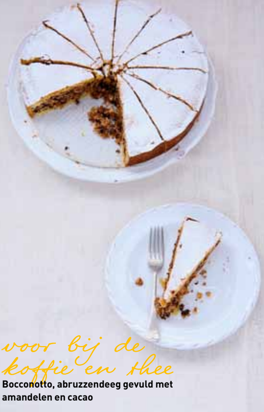
voor bij de koffie en thee Bocconotto, abruzzendeeg gevuld met amandelen en cacao

wat natuurlijk wel anders smaakt maar ook erg lekker is. Evt. kun je de jam zelf maken. Kook hiervoor 500 g gehalveerde blauwe druiven (pitjes erin laten voor de pectine) met 1 kg 'geleisuiker speciaal' volgens de beschrijving op het pak van de geleisuiker. Zeef de jam, zo haal je de pitjes en schillen eruit. Doe over in schone potten en sluit af. Bereiden ± 45 min. / wachten ± 3 uur / oven ± 20 min. / afkoelen ± 1 uur