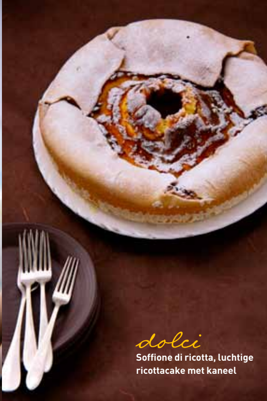
dolci Soffione di ricotta, luchtige ricottacake met kaneel